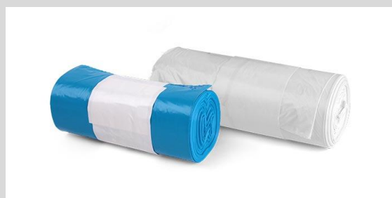
Linea con etichetta neutra