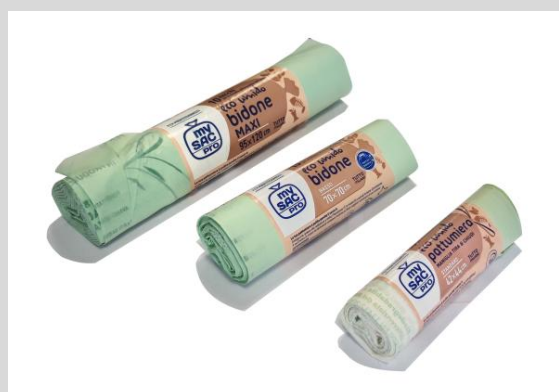
Linea raccolta differenziata - Frazione Secca e Organica