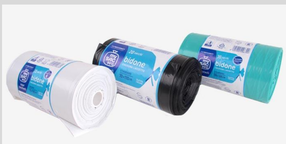
Linea raccolta indifferenziata